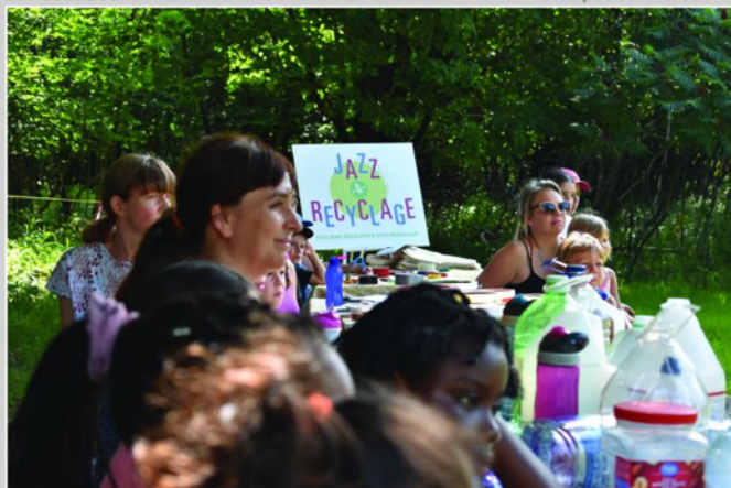
L'activité Jazz et recyclage avait lieu au Mont-Saint-Bruno.

Le 29 juillet dernier, l'activité Jazz et recyclage au Mont-Saint-Bruno inaugurait le nouveau partenariat de l'organisme Jeunes engagés pour le développement durable (JEDD).