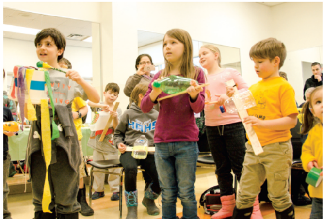
Des jeunes qui assistent à l'atelier « Jazz et recyclage. »

Le Festival Écolo est un événement écoresponsable d'une journée, dont les activités visent à rassembler sous un même toit